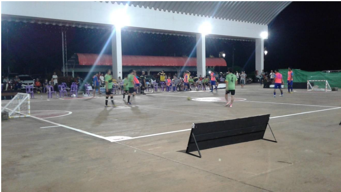
ลานกีฬาหมู่ที่ ๓ ซอย ๒๘

(๒)(๓) สามารถใช้งานได้ ไม่น้อยกว่าร้อยละ ๕๐.๐๐ ของจำนวนหมู่บ้าน/ชุมชน ใน อปท.