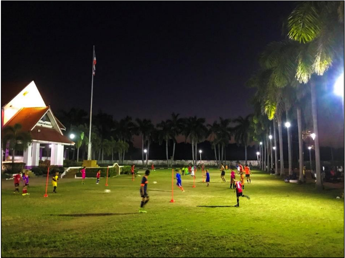
ลานกีฬา/สวนสุขภาพ ชุมชน ๕ ซอย ๖